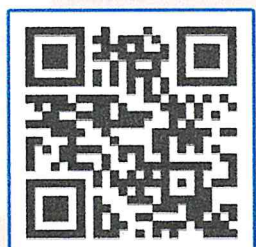
ลงทะเบียน ส่งบทความ

25 ธ.ค. 66 - 25 ก.พ. 67 ส่งบทความและชำระค่าลงทะเบียน 1 มี.ค. 67 ประกาศรายชื่อบทความ 4 มี.ค. 67 ประกาศห้องนำเสนอบทความ 8 มี.ค. 67 จัดงานประชุมวิชาการระดับชาติ