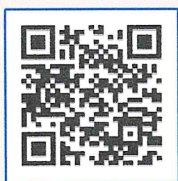
แจ้งชำระค่าลงทะเบียน